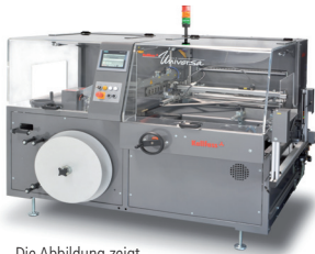
Die Abbildung zeigt möglicherweise aufpreispflichtige Sonderausstattungen

Dieser Trumpf bietet bewährte Technik und das zu einem ausgezeichneten Preis-Leistungs-Verhältnis. Fertigungsbetriebe mit breitem Produktspektrum sowie Industrieservice- und Lohnverpackungsbetriebe profitieren in hohem Maße durch rationelle Fertigungsabläufe und einfache Handhabung der robusten, zuverlässigen Folienverpackungsanlage.