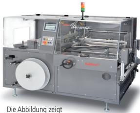
Die Abbildung zeigt möglicherweise aufpreispflichtige Sonderausstattungen

Der Name dieser universellen Folienverpackungsmaschine verrät Konzeption und Zielsetzung. Fertigungsbetriebe mit breitem Produktspektrum sowie Industrieservice- und Lohnverpackungsbetriebe profitieren in hohem Maße durch rationelle Fertigungsabläufe. Präzises Einhalten der Beutellänge stellt den hohen Qualitätsstandard der Folienverpackung sicher.