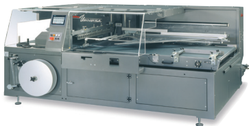
Die Abbildung zeigt möglicherweise aufpreispflichtige Sonderausstattungen

Der Name dieser universellen Folienverpackungsmaschine verrät Konzeption und Zielsetzung. Fertigungsbetriebe mit breitem Produktspektrum sowie Industrieservice- und Lohnverpackungsbetriebe profitieren in hohem Maße durch rationelle Fertigungsabläufe. Präzises Einhalten der Beutellänge stellt den hohen Qualitätsstandard der Folienverpackung für die ganz großen Produkte sicher.