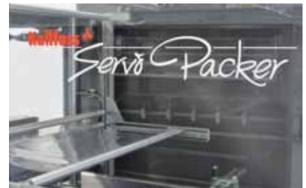
Der Servo Packer 500 T mit taktender Arbeitsweise in gewohnter Kallfass-Qualität