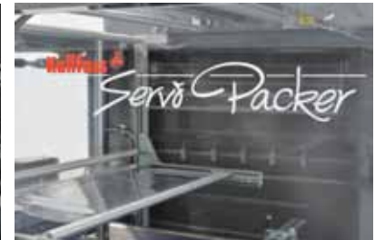
Der Servo Packer 1000 T mit taktender Arbeitsweise in gewohnter Kallfass-Qualität