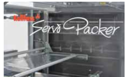
Der Servo Packer 1000 T mit taktender Arbeitsweise in gewohnter Kallfass-Qualität