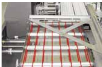
Polycord Zuführung in Edelstahl

(Diese Zeichnung zeigt möglicherweise aufpreispflichtige Sonderausstattungen, die im Preis des Angebots nicht enthalten sind.)